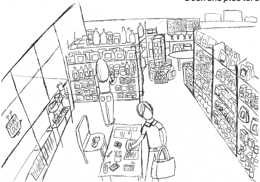
Deux ans plus tard