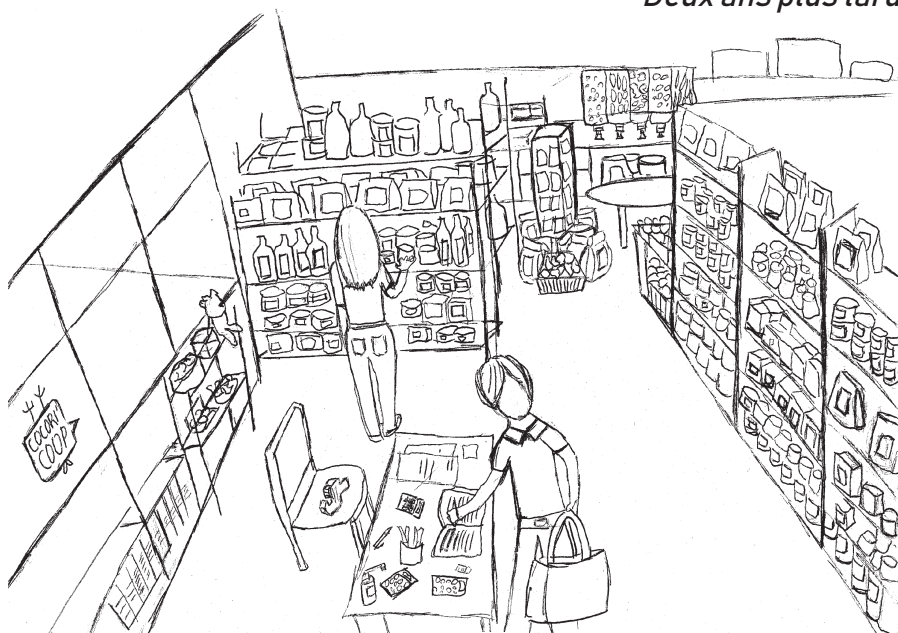
Deux ans plus tard